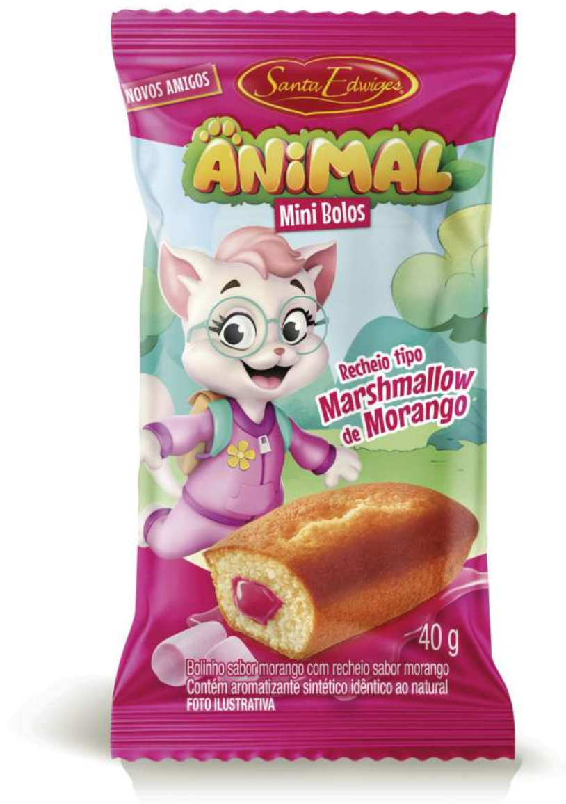
Mini bolo animal morango com recheio tipo marshmallow de morango 40g.