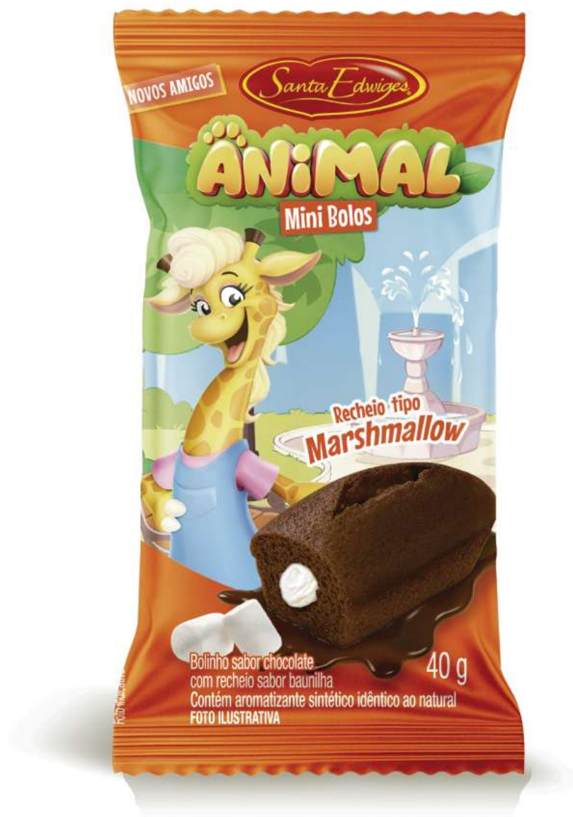
Mini bolo animal chocolate com recheio tipo marshmallow 40g.