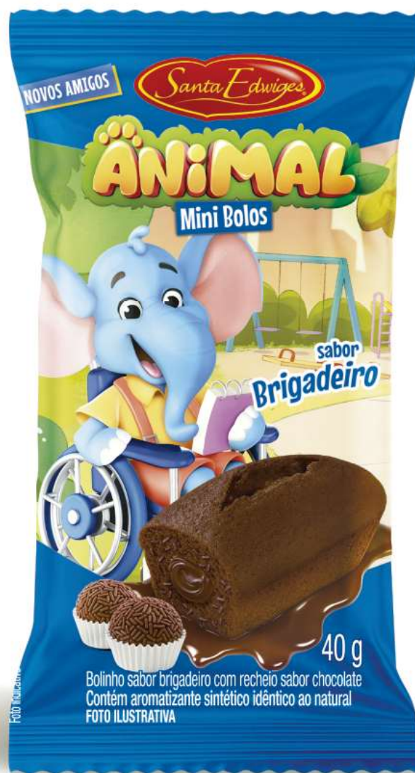
Mini bolo animal brigadeiro com recheio de chocolate 40g.