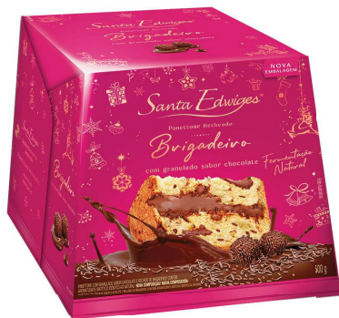
Panettone premium recheado brigadeiro e granulado 500g.