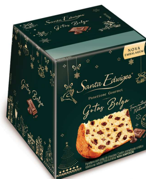
Mini panettone com gotas de chocolate belga 80g.