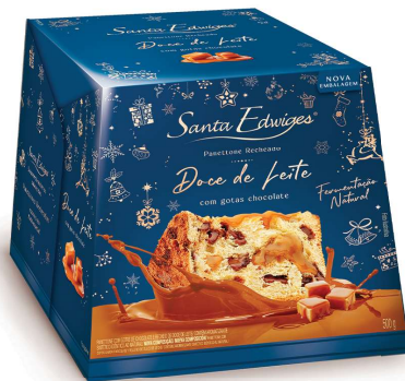
Panettone premium recheado doce de leite e gotas de chocolate 500g.